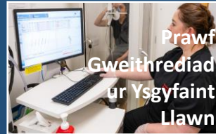
Prawf Gweithrediad ur Ysgyfaint Llawr