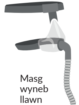
Masg wyneb llawn