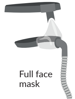
Full face mask